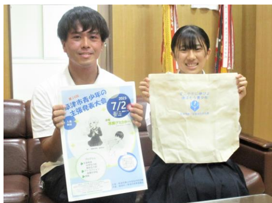
運営とアトラクションの記念品と謝礼を贈呈された 生活委員長と生徒会担当教員