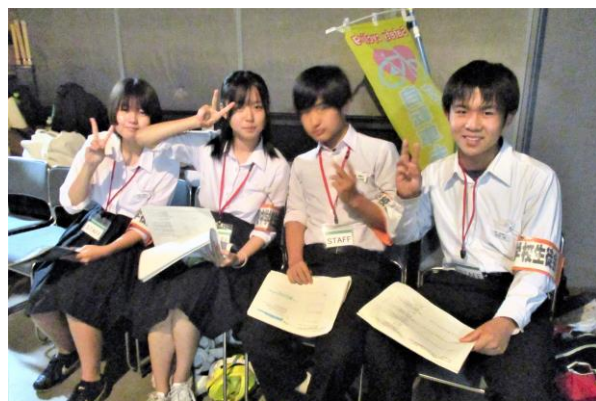
ステージ横で待機する運営役員