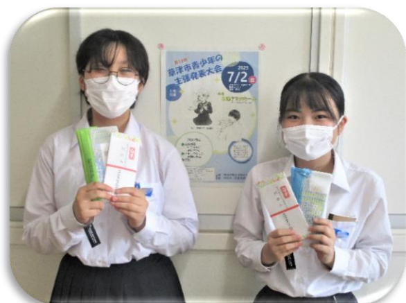
開催通知ポスターのイラストを描いた2年生の生徒さん