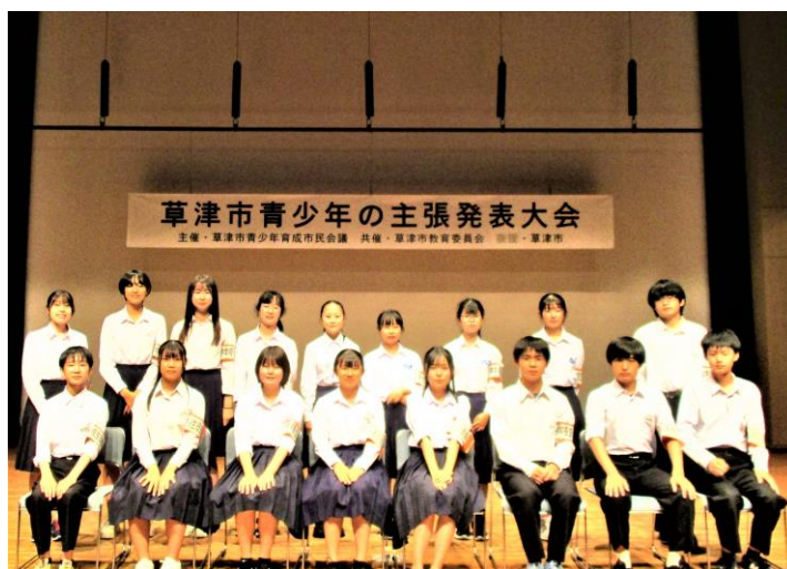
閉会後の生徒会記念写真