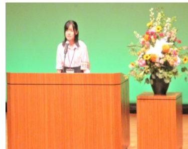
ステージ上で開会宣言をする生徒会長

7月2日(日曜)、草津市アミカホールで「草津市青少年の主張発表大会」が開かれ、本校生徒会のみなさんが大会運営とアトラクションを担当し、大会を成功裏に収めることができました。