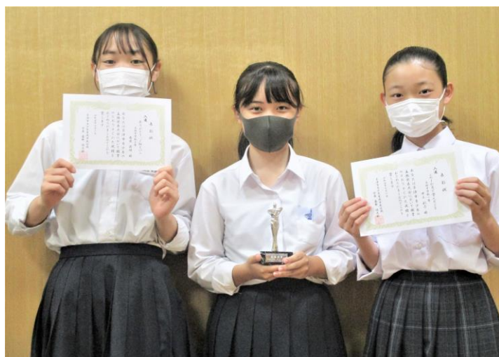
主張作文の各学年代表の生徒さん