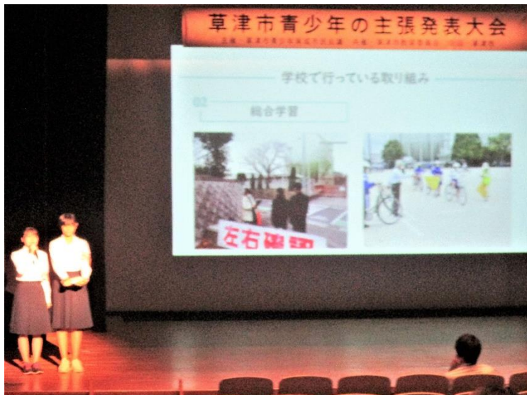
アトラクション：生活委員長中心とした参加型交通安全啓発プレゼン